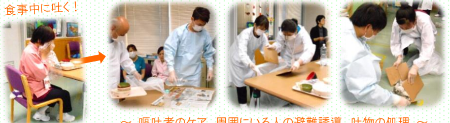
～ 嘔吐者のケア、周囲にいる人の避難誘導、吐物の処理 ～

食事場面を想定した演習により、スタッフそれぞれの役割や、一連の対応手順を再確認できました。感染を発生させないことが最も重要なことですが、嘔吐など感染を疑う状況が生じた際に、迅速に動き、適切な対処ができることも大切！そして、チームワークの大切さも改めて実感しました。この冬も、院内感染ゼロを目指します。